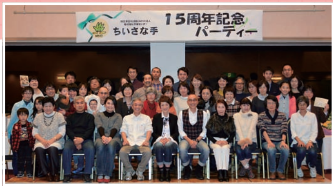
こんなに多くの皆さんに支えられて!!