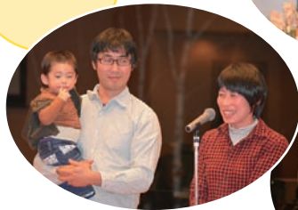
ご参加くださった皆さんより あたたかいお言葉を頂きました。