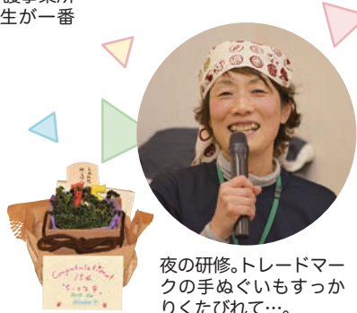
夜の研修。トレードマークの手ぬいもすっかりくたびれて…。