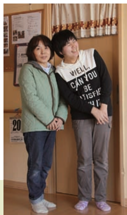
仲良しのお母さんと！