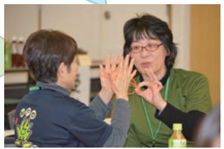
皆すっかり利用者の気分。