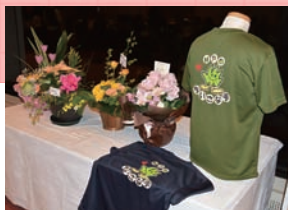
ちいさな手Tシャツ作りました!